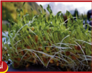
١٧ كانون الأول