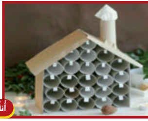
٢٢ كانون الأول