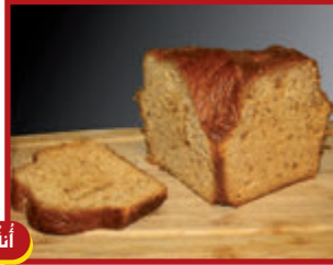
١٩ كانون الأول