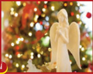
٢٠ كانون الأول