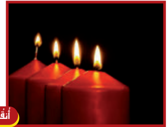
١٥ كانون الأول