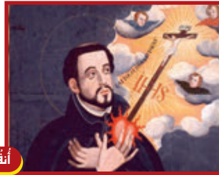
١٦ كانون الأول