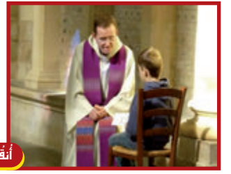
٢١ كانون الأول