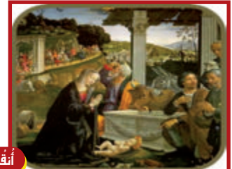
١٨ كانون الأول