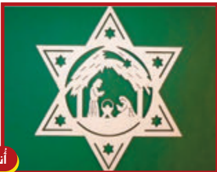
٢٣ كانون الأول

الرَّبُّ آتٍ فِي الْفَنِّ ... الرَّبُّ آتٍ فِي بَيْتِي ... الرَّبُّ آتٍ فِي عَائِلَتِي ...